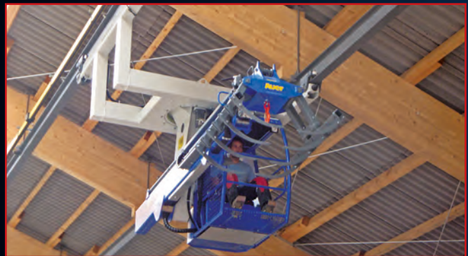
Einseitig abgesetztes Fahrwerk – optimale Anpassung am Gebäude (hydr. Greiferhochstellung).