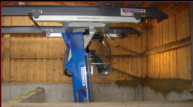
Querfahrwerk – optimale Übersicht und nahe an der schweren Last (Hubarm senkrecht nach unten).