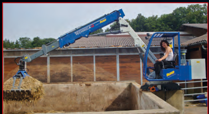
Stationär-/Mobilkrane in diversen Ausführungen, Greifer mit doppelten Laschen (Rotator mit Pendelbremse).