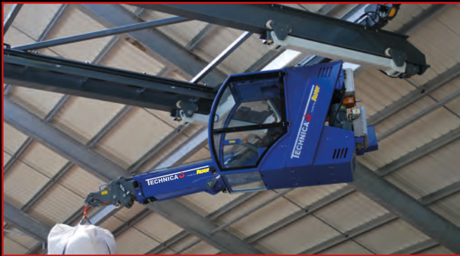
Querfahrwerke bis 34 m bieten bei breiten Gebäuden eine optimale Raumaussnutzung (geschlossene Kabine mit Funk).