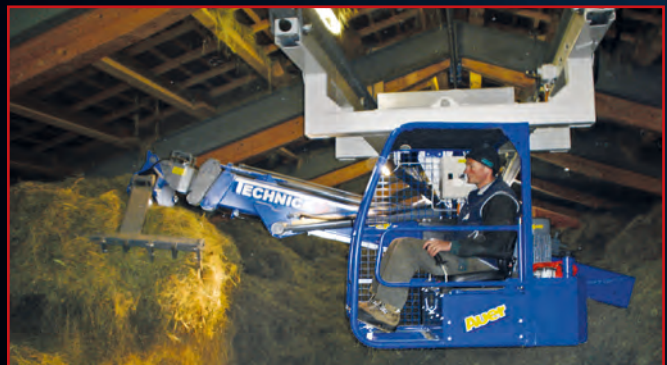
Beidseitig abgesetztes Fahrwerk unter dem Heuverteiler (hydr. Greiferhochstellung 130°).