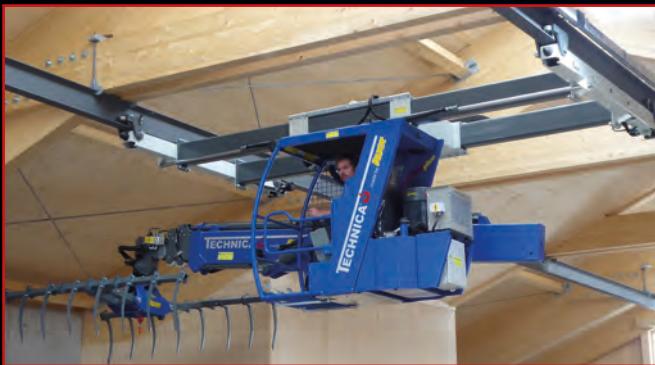
Hydr. Verschieberahmen mit Zylinder, Endlosrotator mit integrierter hydr. Greiferhochstellung seitlich pendelnd.